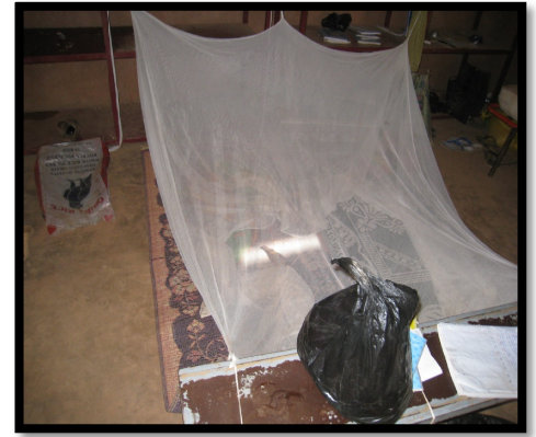
3. Esterillas en el suelo para dormir.