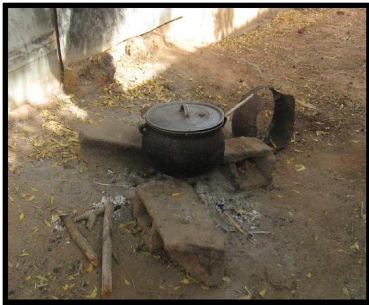
5. Cocina actual.