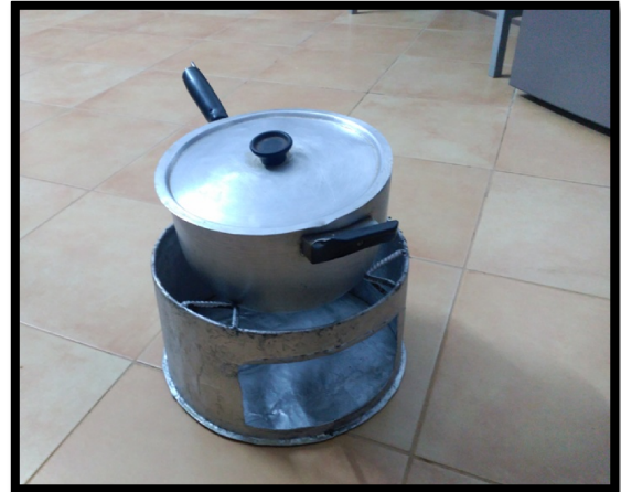
6. Cocina ECOLOGICA.